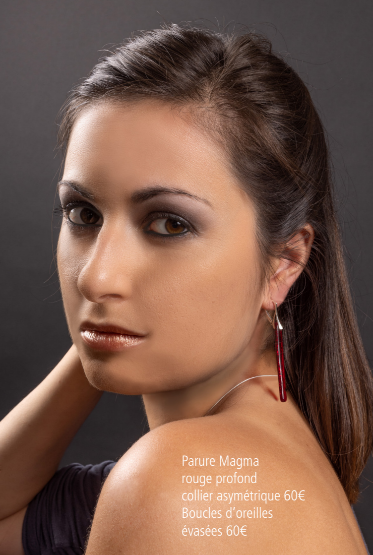
Parure Magma rouge profond collier asymétrique 60€ Boucles d'oreilles évasées 60€