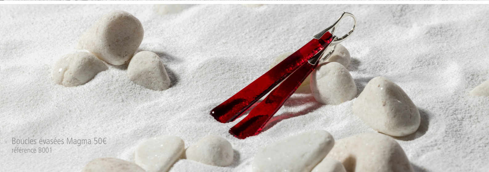
Boucles évasées Magma 50€ référence B001