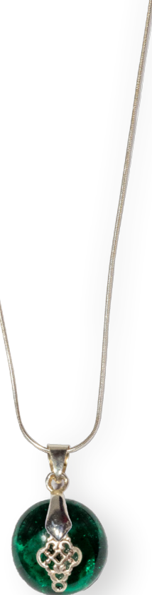
Collier Ombrune vert 60€ référence A010