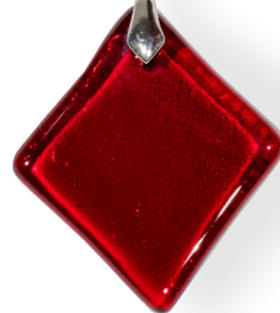
Collier losange Magma 50€ référence B007