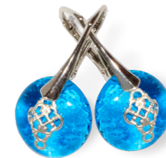
Boucles d'oreilles Ombrune bleu turquoise 60€ référence A008