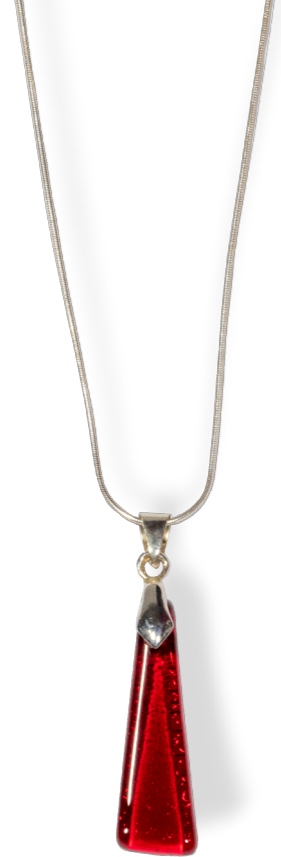
Collier triangle Magma 50€ référence B003