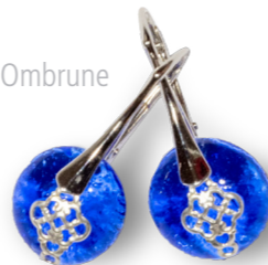
Boucles d'oreilles Ombrune bleu lavande 60€ référence A002