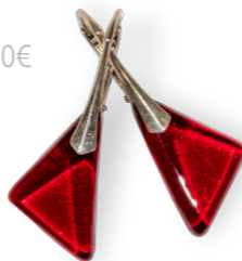
Boucles triangle Magma 50€ référence B005