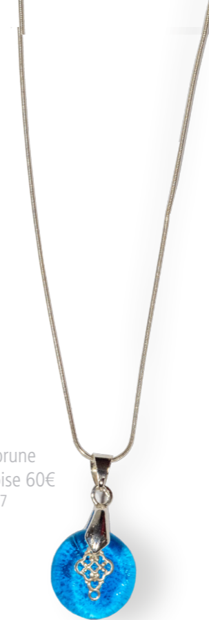
Collier Ombrune bleu turquoise 60€ référence A007