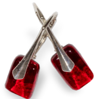
Boucles carrées Magma 50€ référence B004