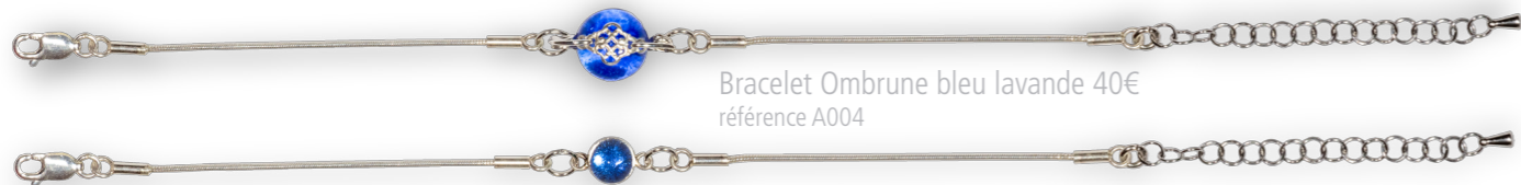
Bracelet Ombrune bleu lavande 40€ référence A004