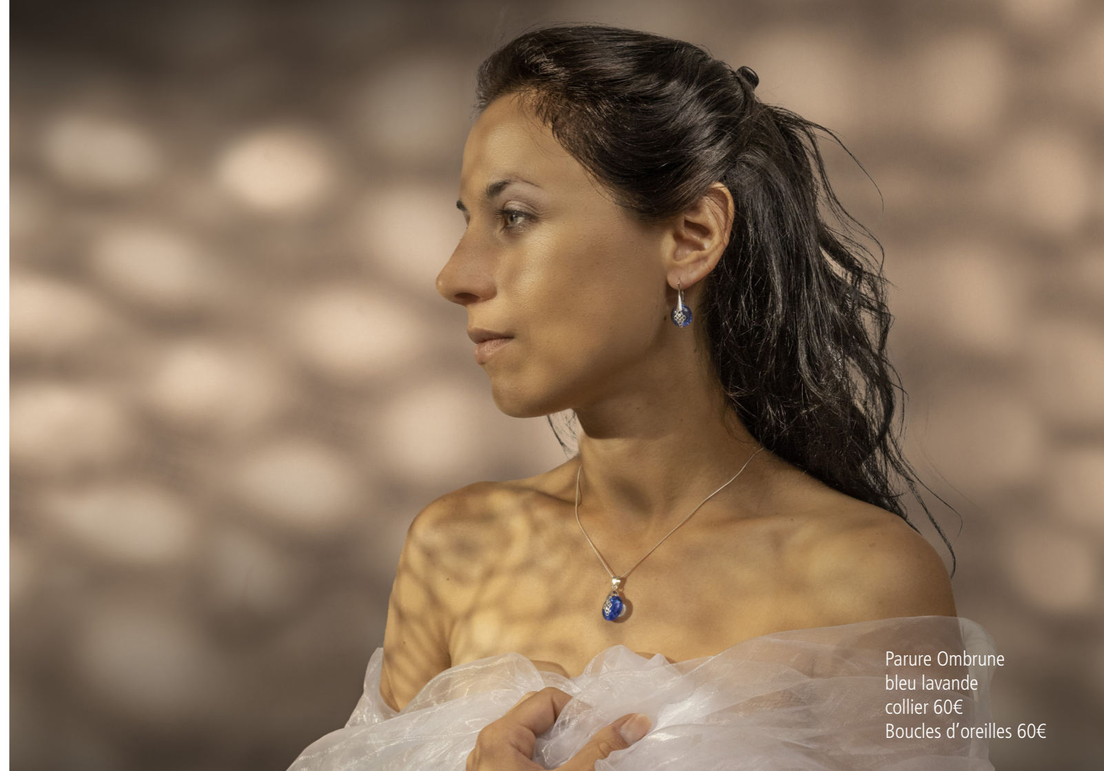
Parure Ombrune bleu lavande collier 60€ Boucles d'oreilles 60€