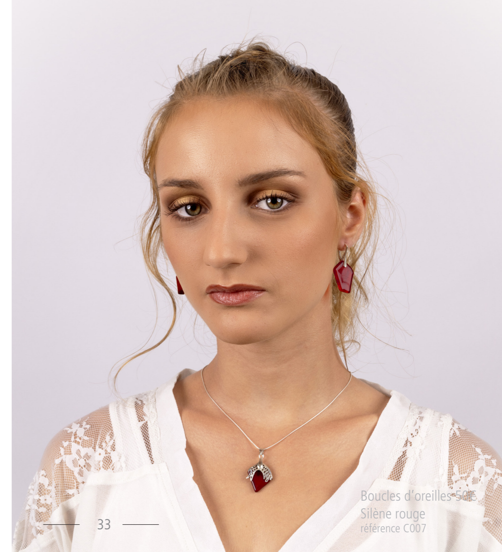
Boucles d'oreilles 50€ Silène rouge référence C007