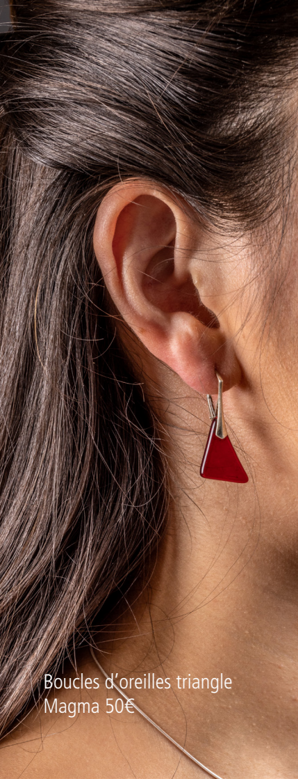
Boucles d'oreilles triangle Magma 50€