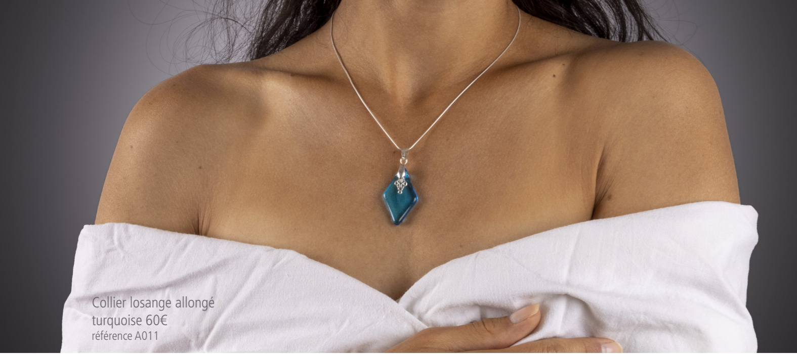
Collier losange allongé turquoise 60€ référence A011