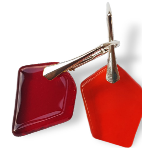
Boucles d'oreilles 50€ Silène orange / rouge référence C011

“ Chaque pièce étant unique par définition, c'est une des qualités de l'artisanat, il est possible d'accentuer cet effet avec une paire asymétrique ! ”