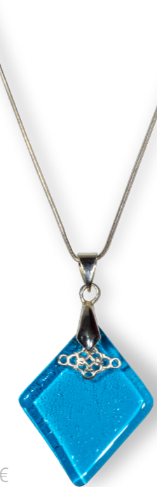
Collier losange turquoise 60€ référence A013