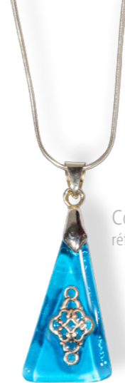
Collier triangle turquoise 60€ référence A012