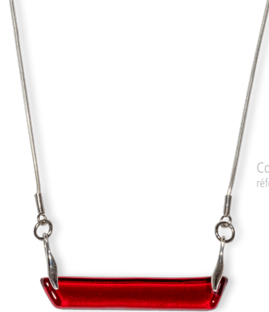
Collier horizontal Magma 60€ référence B008