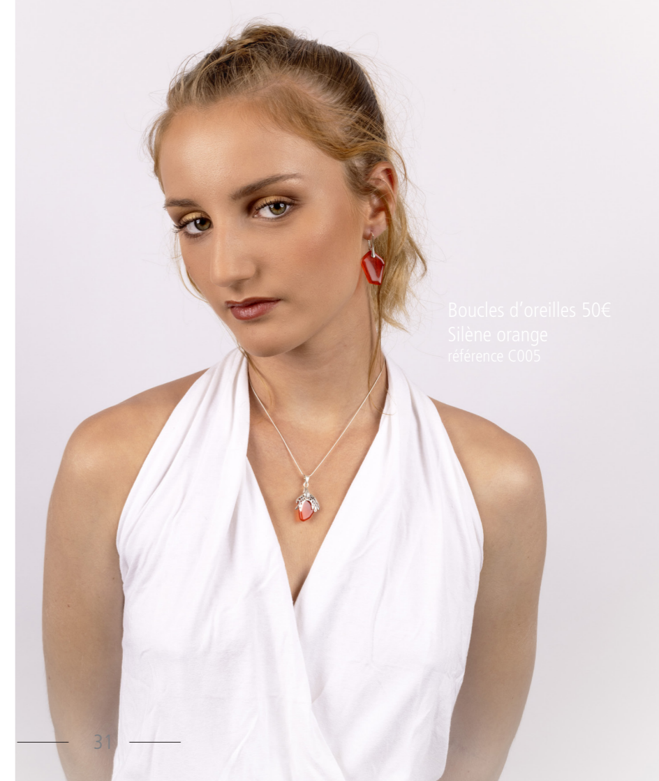
Boucles d'oreilles 50€ Silène orange référence C005