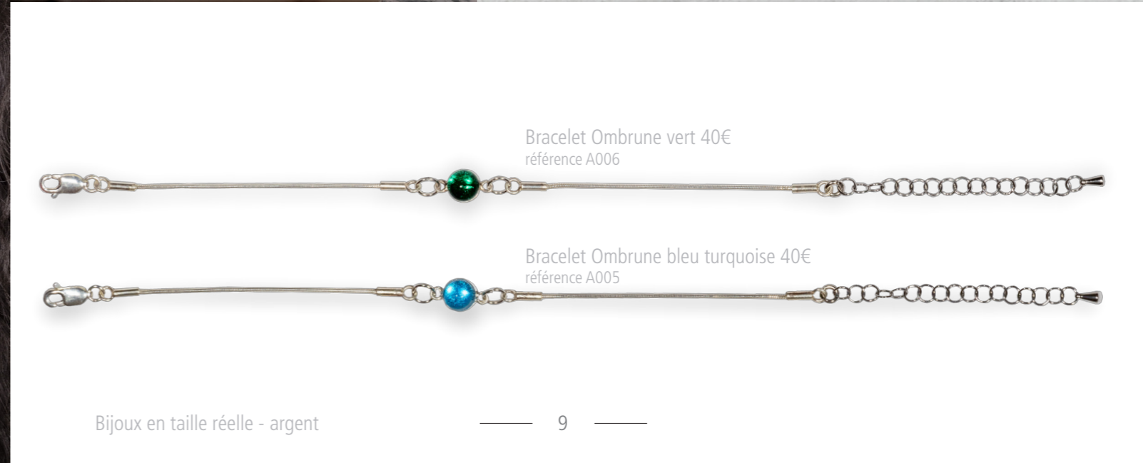
Bracelet Ombrune vert 40€ référence A006