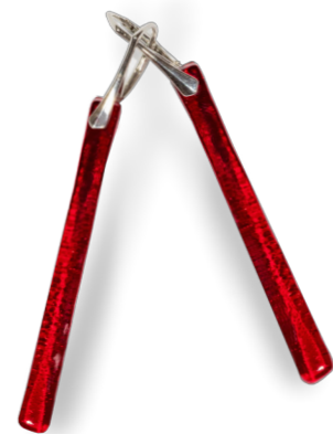
Boucles longue Magma 50€ ~6 cm de long (monture comprise) référence B009