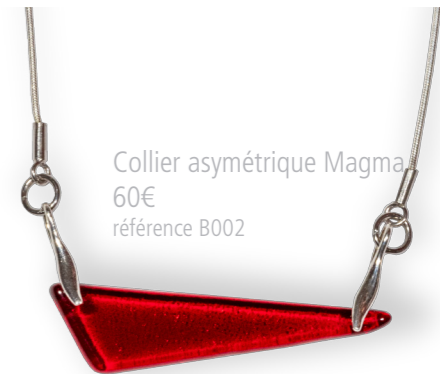
Collier asymétrique Magma 60€ référence B002