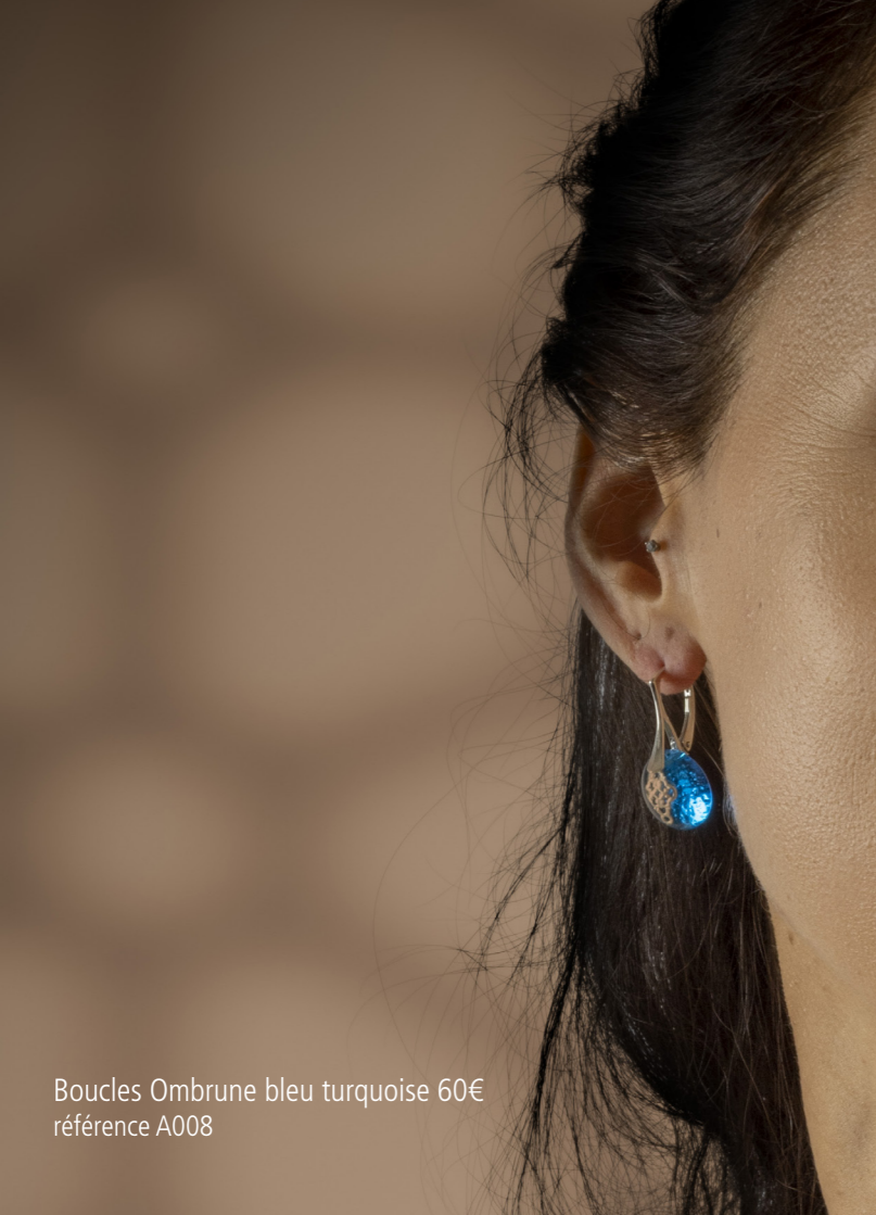
Boucles Ombrune bleu turquoise 60€ référence A008