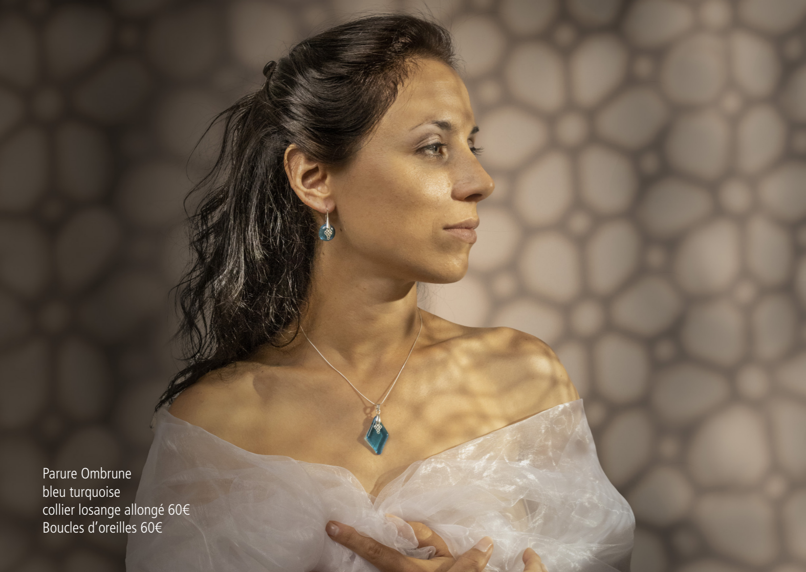
Parure Ombrune bleu turquoise collier losange allongé 60€ Boucles d'oreilles 60€