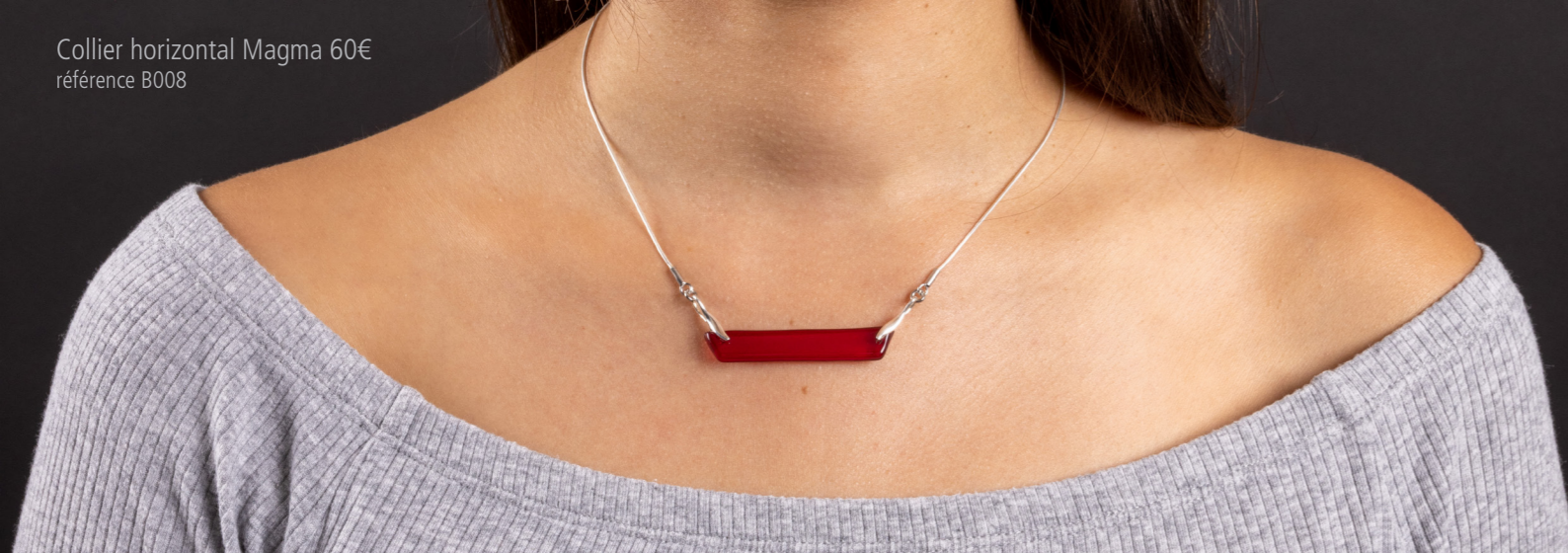
Collier horizontal Magma 60€ référence B008