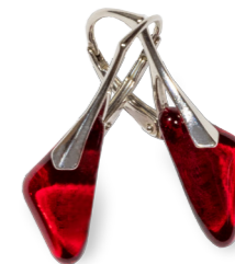
Boucles évasées Magma 50€ référence B006