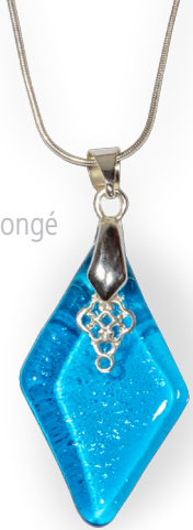
Collier losange allongé turquoise 60€ référence A011