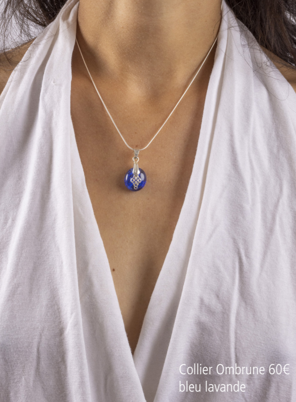
Collier Ombrune 60€ bleu lavande