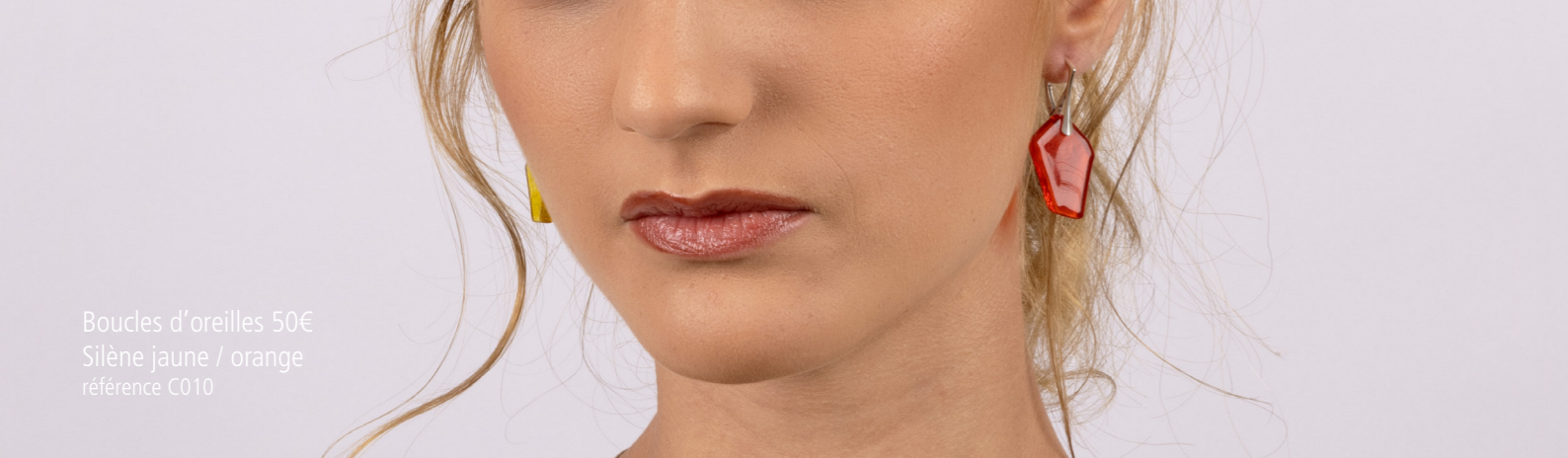
Boucles d'oreilles 50€ Silène jaune / orange référence C010