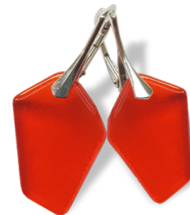
Boucles d'oreilles 50€ Silène losange orange référence C005