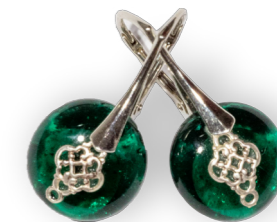
Boucles d'oreilles Ombrune vertes 60€ référence A009