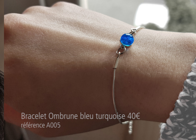
Bracelet Ombrune bleu turquoise 40€ référence A005