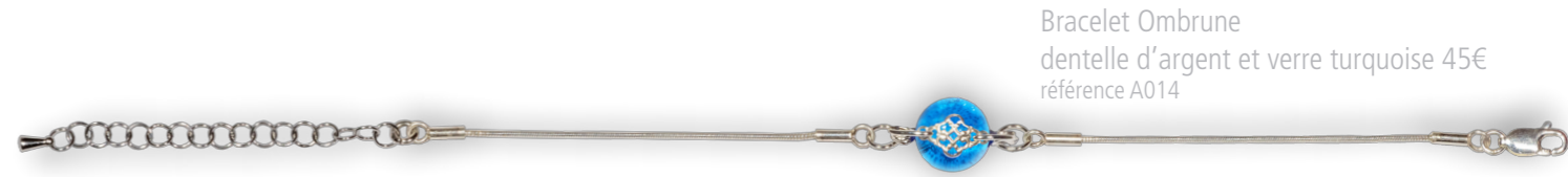
Bracelet Ombrune dentelle d'argent et verre turquoise 45€ référence A014