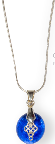
Collier Ombrune bleu lavande 60€ référence A001